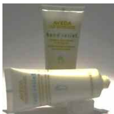
Hand- und Fußcreme € 9,-