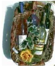
Präsentkorb mit Sommerwein € 37,-