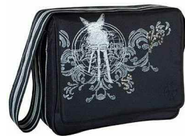
Wickeltasche "Lässig" € 69,95